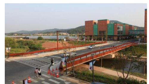
풍유교 : 최문규