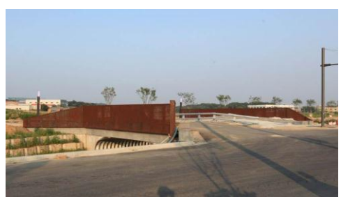
이명교 : 김승희