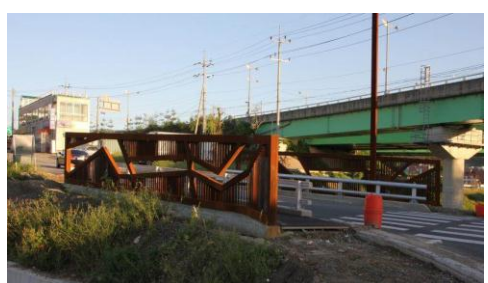
문발교 : 장윤규