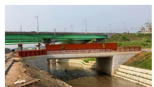
노주교 : 이민아