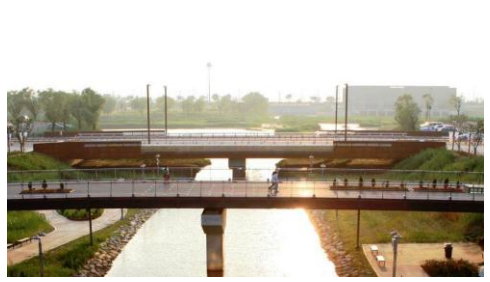
춘사교 : 이종호