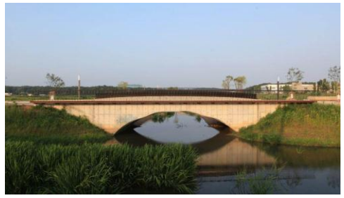
곡직교 : 조민석